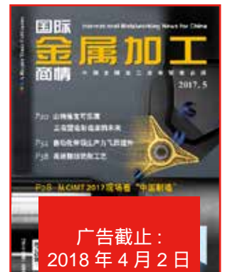
《国际金属加工商情》 (5月号)