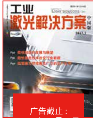
《工业激光解决方案 - 中国版》 (6月号)