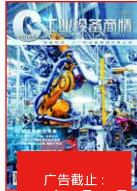
《工业设备商情》 (6月号)