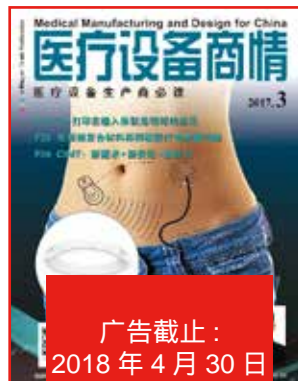
《医疗设备商情》 (6月号)