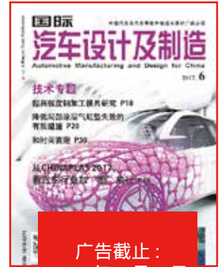
《国际汽车设计及制造》 (6月号)