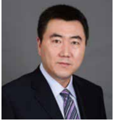
鞠强 主任医师,上海交通大学医学院 附属仁济医院皮肤科主任 演讲议题:痤疮,激素依赖性皮炎 修复