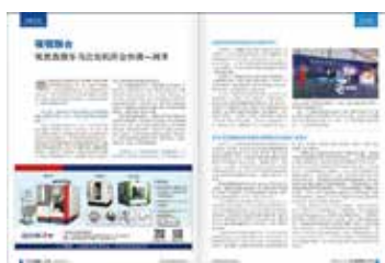
电子杂志上的广告