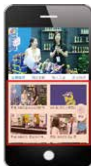
5分钟以内短视频 (产品介绍 + 采访)