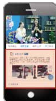
图文直播 (展会摊位照片 + 文字)