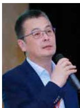
张远明 中国科学院宁波材料技术与工程研究所 教授 演讲题目: 先进增材制造技术在模具行业中的应用与挑战