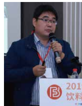
赵伟 博士 江南大学食品学院 教授, 博士生导师