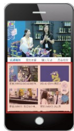
5分钟以内短视频 (产品介绍 + 采访)