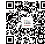
关注荣格工业传媒微信号，获得更多工业、荣格活动信息