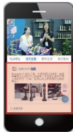
图文直播 (展会摊位照片 + 文字)