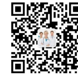
荣格医疗器械资讯行业微信号