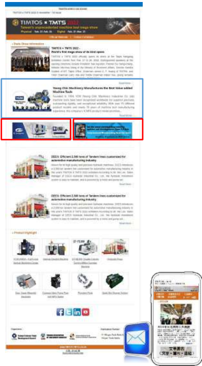
Show Daily 電子報示意圖